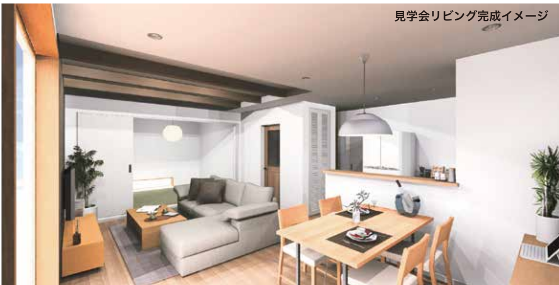
見学会リビング完成イメージ

※今回の見学会は近い将来、新築・リフォームのご計画のある方に限らせて頂きます。 他社にてご契約済及びご契約予定の方やご計画の無い方のご見学はお控え下さい。